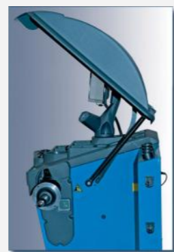
Patenterad platsbesparande skyddsskärm som kan fällas upp helt även om balanse-