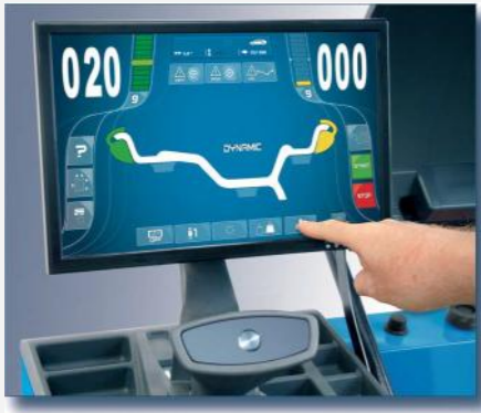
Grafiskt interface med Touchskärm 16/9 Multifunktionsknapp för enkla programval