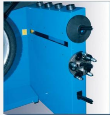
Kraftig bakpanel med fästen för konor och tillbehör