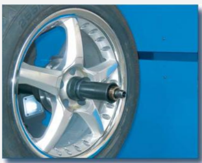
Automatisk positionering efter inbromsning Integrerad LED belysning för enkel vikt placering