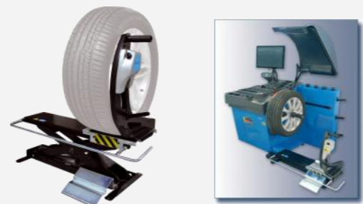
Kan utrustas med "nollviktslyft" som elimineras hjulets vikt