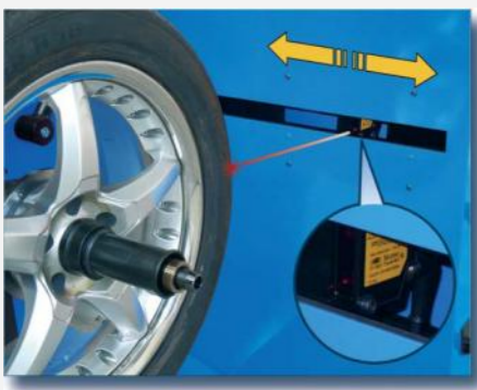
Touchless inläsning av alla hjuldata under balanseringen. Elektriskt hjullås med krok