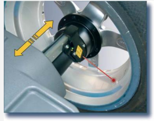
Den integrerade laserpekaren indikerar exakt positionering av klistervikter . Viktreducerings- program. Laser run-out