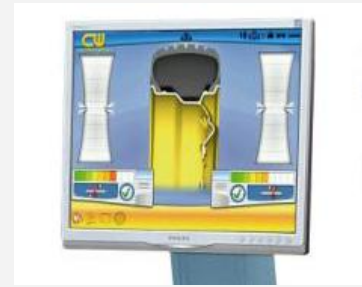
Tydlig 22" LCD monitor