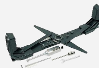
MC Tillsats FAGTM2 Konset FAGARP142