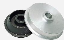
Konor: 94,5 - 119,5 mm FAARF94 119 - 168 mm FACDF