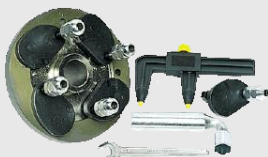
Universalfläns 3 - 8 hålsfälgar FA8-2110.00.91

(fler tillbehör finns på www.carpart.se )