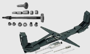
MC Tillsats Grundsets FA8-2110.01.03 Axel med konor FAGARP142