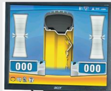
Lättarbetad och enkel display

Med SONAR (tillval) mäts fälgbredden automatiskt.