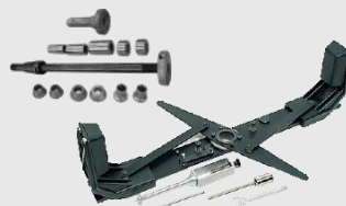
MC Tillsats Grundsets FA8-2110.01.03 Axel med konor FAGARP142