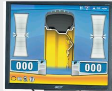
Lättarbetad och enkel display

Med SONAR (tillval) mäts fälgbredden automatiskt.