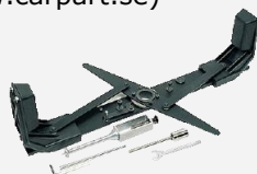
MC Tillsats Grundsats: FA8-2110.01.03 Konset: FAGARP142