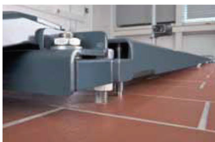
Höjdkompensering upp till 40 mm