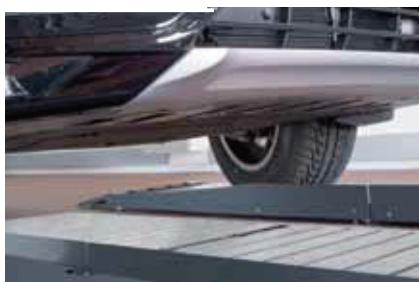
Som tillval avkörningsskydd